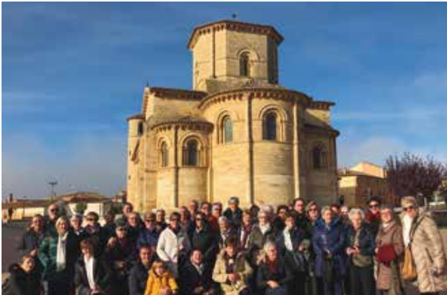
Los estudiantes y docentes frente a la iglesia románica de San Martín en Frómista.

A principios de noviembre, estudiantes y profesores de la UMAFY realizaron un viaje cultural a Castilla y León, donde visitaron la exposición Las Edades del Hombre.