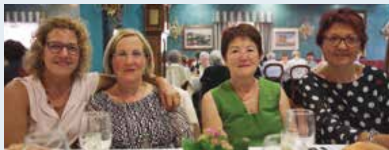
Después de la entrega de diplomas, se celebró la tradicional comida de hermandad.