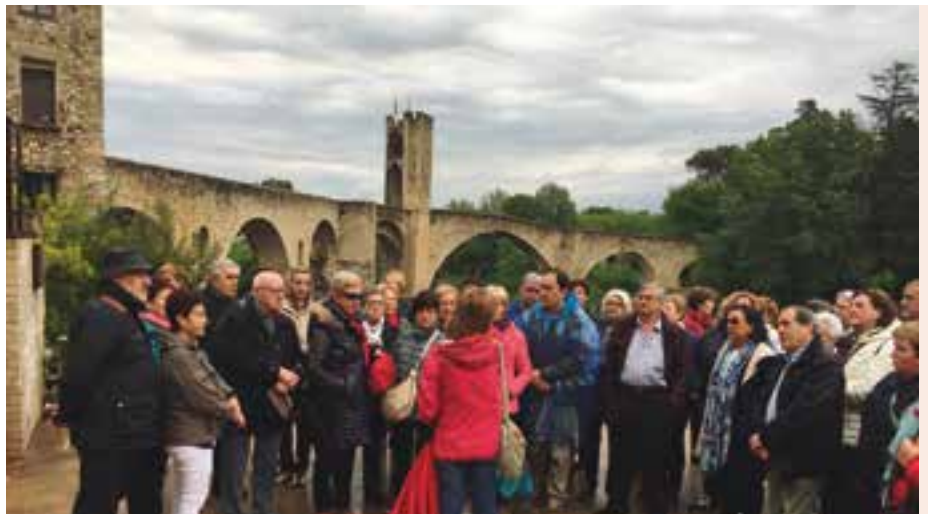
1. Frente al Teatro Museo Dalí, en Figueras.

Tras comer en Olot, los estudiantes y profesores regresaron a Navarra después de unos días inolvidables.