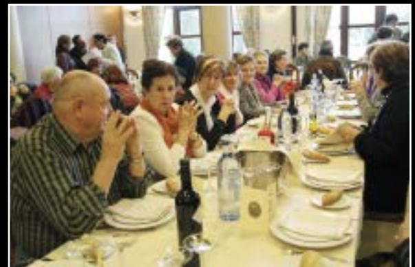
Los ganadores, amigos y familiares de los premiados y de Bilaketa disfrutaron, tras la ceremonia de entrega, de una agradable comida en buena compañía.