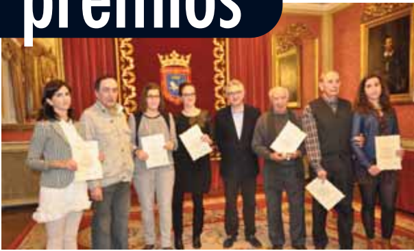
Los premiados posaron en el salón de recepciones del Ayuntamiento de Pamplona.