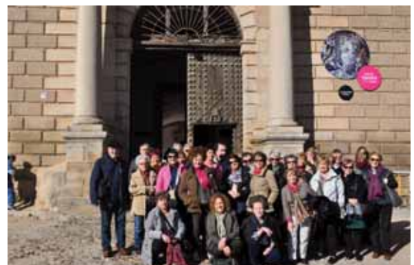
El grupo, en la puerta del Hospital Tavera.

El último día, y tras completar una visita guiada por el emblemático Barrio de las Letras en el que fijaron su residencia algunos de los literatos más destacados del Siglo de Oro, se desplazaron hasta el Museo Thyssen-Bornemisza para contemplar la exposición 'Cézanne Site / Non-site'.