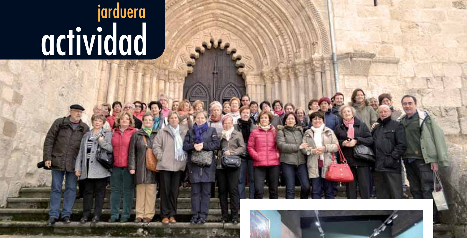
Los estudiantes en la escalera de la iglesia de San Pedro de la Rúa (arriba) y en el Museo Gustavo de Maeztu (derecha).