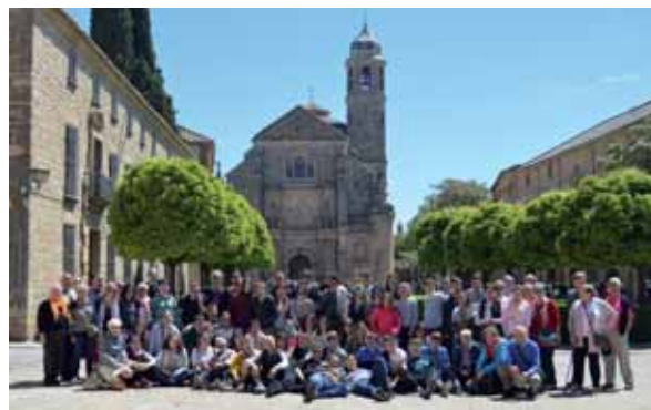
Frente al parador de Úbeda.

Fueron más de 80 las personas de Bilaketa que se desplazaron hasta tierras andaluzas para disfrutar de sus encantos. Aprovecharon el lunes 1 de mayo, festivo, para disfrutar de tres días muy interesantes en los que combinaron turismo, cultura, risas y compañerismo.