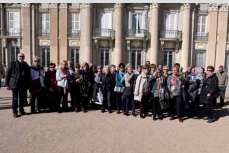
En el Palacio Real de la Granja de San Ildefonso.

Además, el domingo, recorrieron la exposición Tesoros de la Hispanic Society of America. Visiones del mundo hispánico , que reúne cientos de piezas cedidas por la institución estadounidense, que incluye escultura romana, cerámicas, vidrios, muebles, tejidos, metalistería, arte islámico y medieval, obras del Siglo de Oro, arte colonial y del siglo XIX latinoamericano y pintura hispana de los siglos XIX y XX.