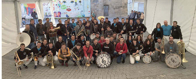
En la última actuación, con el resto de txarangas invitadas al evento conmemorativo.