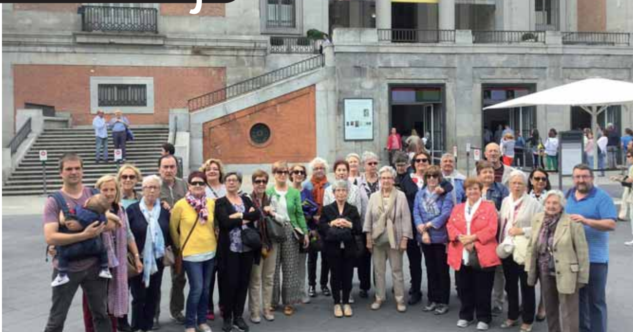
Los estudiantes y profesores, en el Museo Nacional de El Prado.