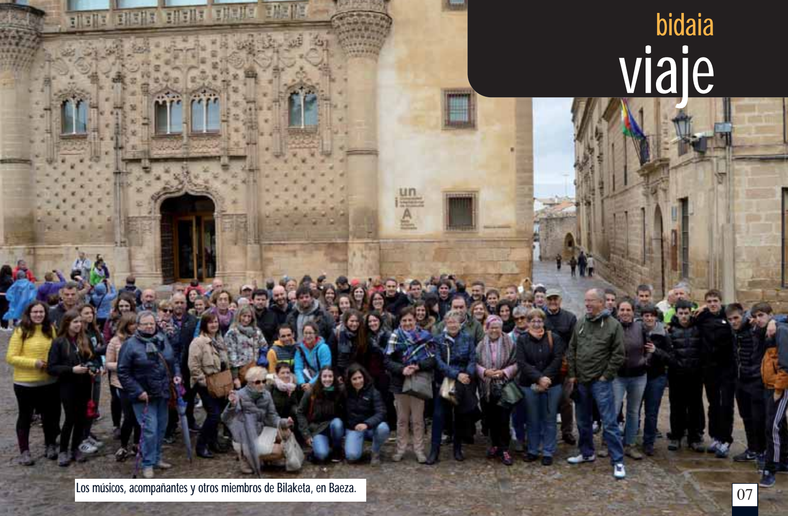
Los músicos, acompañantes y otros miembros de Bilaketa, en Baeza.