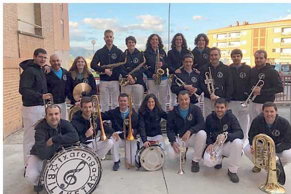
El 28 de octubre de 2017, los miembros de la Txaranga afrontaban juntos su última actuación.

El último día de la txaranga fue inmejorable. El 28 de octubre invitaron a Aoiz a otras tres txarangas, que recorrieron las calles de forma separada para unirse después en un acto de despedida conjunto que fue alegre y emotivo a la vez. Además, aprovecharon la jornada para entregar un ramo de flores a la viuda del fundador e impulsar de un movimiento cuyo espíritu de alegría, compañerismo y pasión por la música va a perdurar durante largo tiempo en Aoiz.