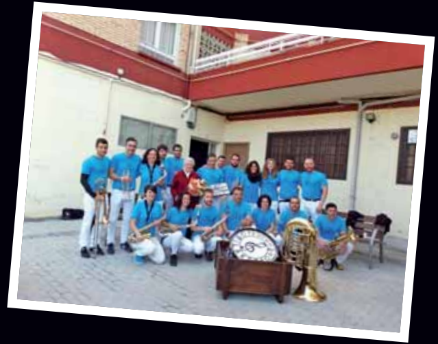
La Txaranga Bilaketa cierra un ciclo de XX años