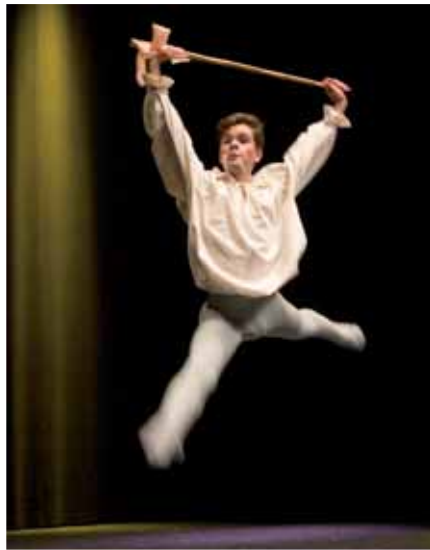
Los estudiantes becados, durante sus actuaciones.