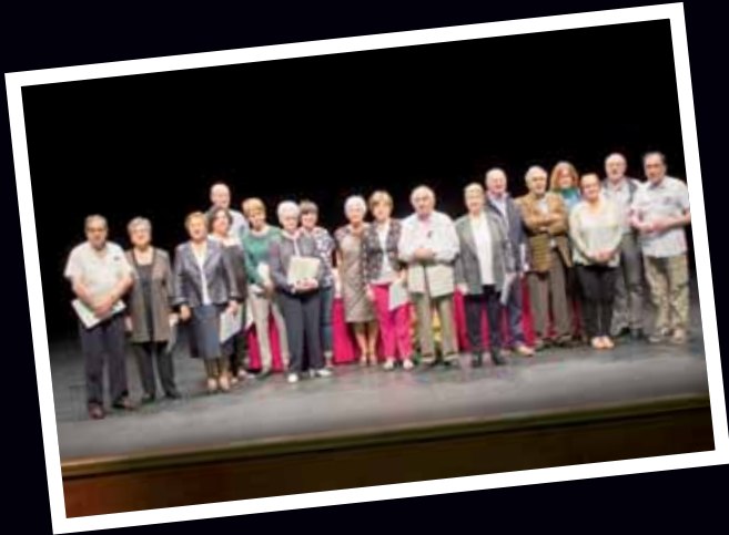
Clausura de la UMAFY