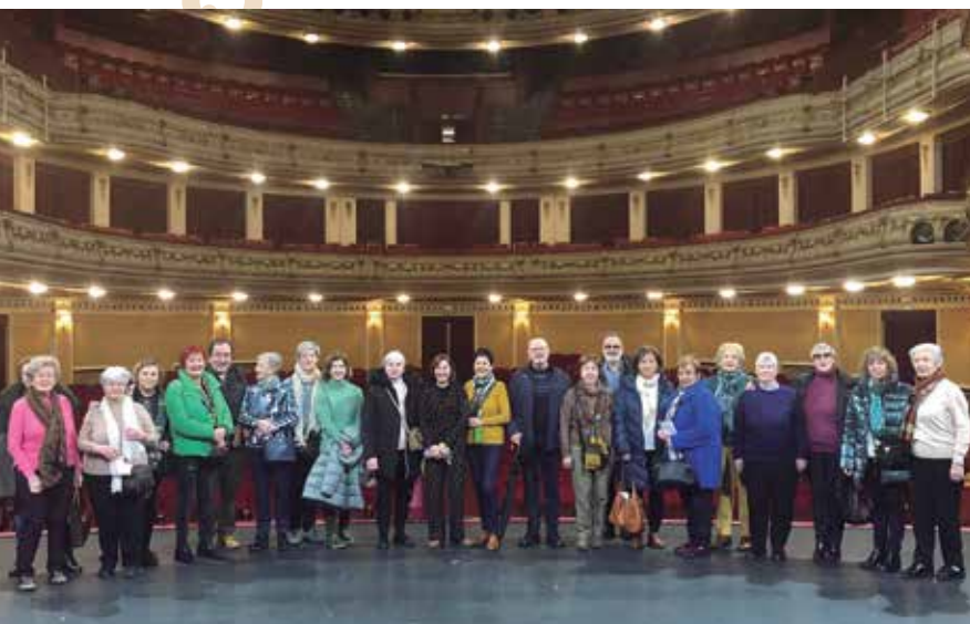
El 29 de febrero la salida fue al Teatro Gayarre.