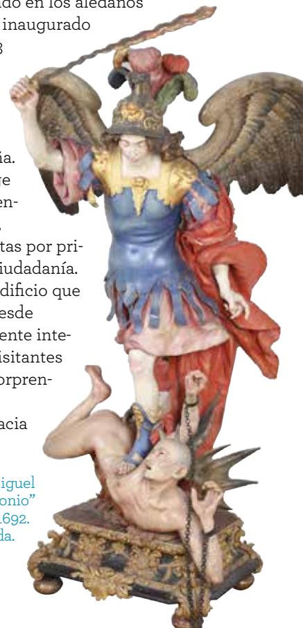
“El arcángel san Miguel venciendo al demonio” Luisa Roldán (La Roldana) 1692. Talla policromada.

el proyecto museístico más importante de cuantos se han puesto en marcha en las últimas décadas en España. Su exposición permanente acoge las valiosas colecciones procedentes del patrimonio de la Corona, con innumerables obras expuestas por primera vez para el disfrute de la ciudadanía. Y no menos espectacular es el edificio que las acoge, excavado en la roca desde el Campo del Moro y perfectamente integrado en el entorno. Nuestros visitantes disfrutaron de su interior, que sorprende por la amplitud de espacios y la luz natural, y de las vistas hacia el paisaje exterior.