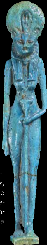
“Amuleto egipcio.” 1609-644 a.C., esmalte, Egipto.

Madrid el fin de semana del 16 y 17 de diciembre, con la ciudad imbuida ya del espíritu navideño. Tras la comida en el Hotel Chamartín, donde se alojó el grupo, se dedicó la tarde del sábado a visitar en la sede de CaixaForum la exposición temporal “Veneradas y temidas. El poder femenino en el arte y las creencias”. Un viaje de 5.000 años desde el mundo antiguo hasta la actualidad que muestra con esculturas, objetos sagrados y obras de arte de varios continentes cómo diosas, demonios, santas y otros seres espirituales han tenido un rol relevante para nuestra comprensión del mundo.