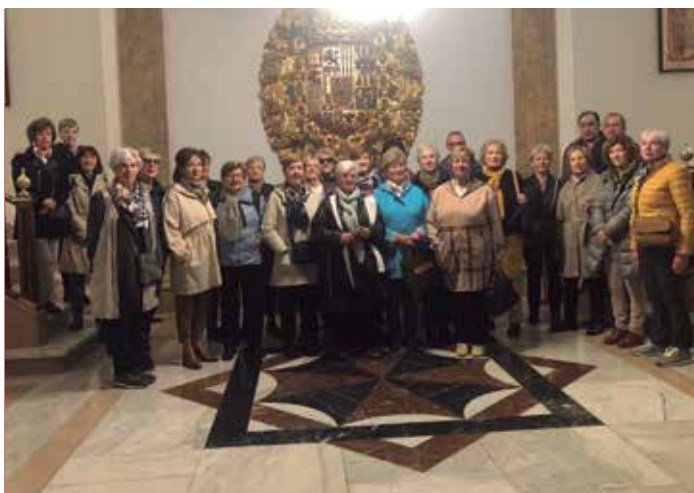
El 16 de noviembre se realizó una visita al Ayuntamiento de Pamplona.