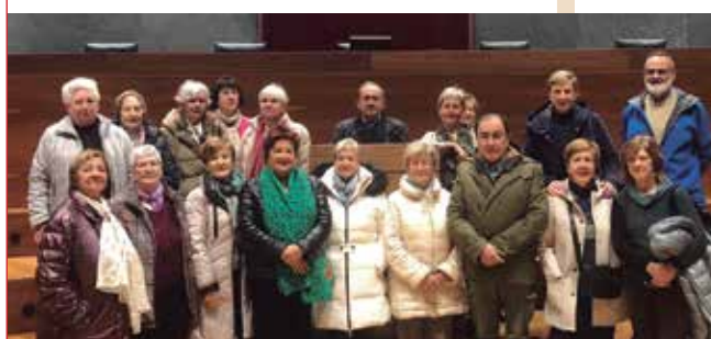
El 22 de noviembre un grupo de estudiantes visitó el Parlamento de Navarra y otro lo hizo el 17 de enero .